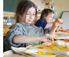
Kunst und Kultur